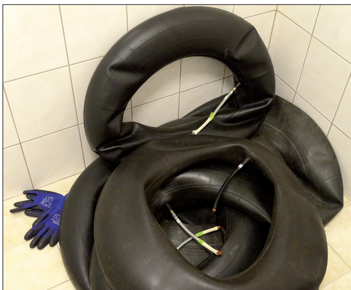
Originální metoda odběru radonu

Nejsme moc velká a mohovitá země. Přesto si dovoluujeme tvrdit, že držíme krok s jinými. Kdyby chtěli, dokonce by se u nás mohli poučit.